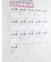
▲毎日見える場所に掲示!

こちらのお客様からは、毎回黒ベタが印象的なパンフレットをご注文いただいていたいました。そんな印刷物の場合、気になるのは「背割れ」と