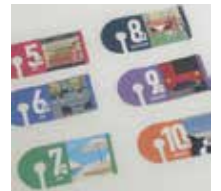
▲上質紙は沈みとの戦い!

増刷でベストが出ました、という前向きなお言葉を頂きましたが、すぐにご希望の発色を出すため、プロファイルの再作成等を行い社内全体の色づくりの環境を再整備しました。