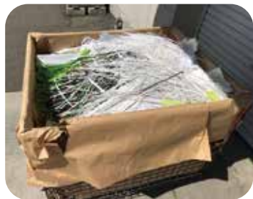
▲ 断裁後に出る用紙の端材の山です。リサイクルされ、再生紙として生まれ変わります!

弊社では少しでも再生紙不足を改善しようと、不要な用紙のリサイクルを進めております。