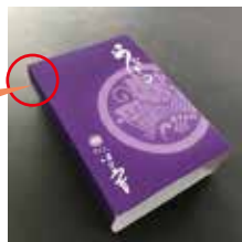
▲はごろも様うなぎ弁当パッケージ