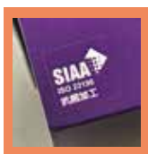
加工済みの商品にはSIAAマークが表示できます▶