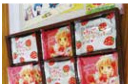
意外と好評だったアキバのお土産▶