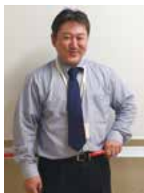
マニアには分かる?! 変身ポーズです。▶

しばらくはアマゾンズ・ロスになりそうですが、なんと要望が多ければロケ地の長野で撮影地ツアーが開催されるというお話も聞きました！たくさんのアマゾンズファンと聖地巡礼ができればと思っています！