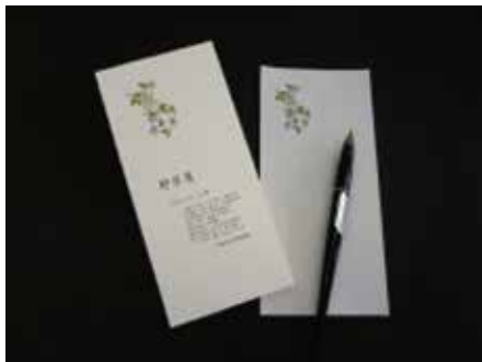
▲ふのり製本で綴じられた一筆箋。

環境に良いものを選ばれる時代、弊社も環境にやさしい取り組みのため、過剰梱包の見直しや紙ごみの分別など引き続き行ってまいります!