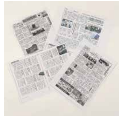
▲各紙でご紹介頂きました。

書籍は上田市の一部書店で販売される他、上田市内の図書館にも所蔵されるという事です。