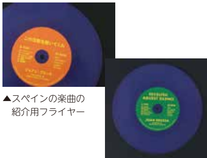
▲スペインの楽曲の紹介用フライヤー

く場合や、目を引くようなフライヤーや、商品メニューなどとしてお使いいただくケースもあるようです。