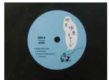
▲レコードショップのフライヤーもお手伝いました!

形は普通の円形型抜きでも、思い出や気持ちがこもると特別な商品になりますね!このような、クラシックメディア風のカットアウトもお気軽にご相談ください!